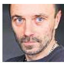
Tomáš Řepka fotbalista

Návrh se značkami na přání je můj. Ministerstvo ho připravuje od mého nástupu. Proto jej podporuji. Sám ovšem po značce na míru netoužím. Jsem rád, že tu, co mám, si pamatuji.