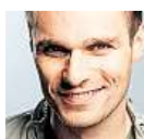
Leoš Mareš moderátor

Zaplatíte si značku na přání? Pokud ano, co na ní budete mít?