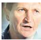
Alois Hadamczik hokejový trenér

Taková právní úprava je mi úplně jedno. Já bych do takové značky nešel. Doufám, že to státu přinese nějaké peníze a že náklady na administrativu nepřevyšují příjmy z této služby.