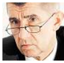
Andrej Babiš podnikatel

Já o značku na míru určitě nepožádám. Něco jiného je firemní vůz. Z hlediska obchodníka bych o tom uvažoval jako o formě reklamy. Tento krok vlády vítám. Poslouží k odstranění korupčního prostředí.