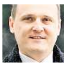
Vít Bárta poslanec

O lidech, kteří potřebují speciální značky na autech, si myslím svoje. Já se snažím mít co nejběžnější, nepotřebuju na sebe upozorňovat. Spíš bych víc zaplatil za normální značku, pokud by to bylo potřeba. Dokážu to ale pochopit třeba pro reklamní účely.