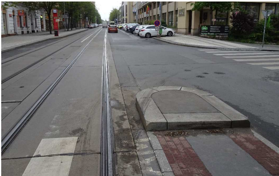
Obrázek 2: Dělicí ostrůvek přechodu pro chodce u tramvajové zastávky Perunova

protisměrného jízdního pruhu Chorvatské ul. Bez provedení nutných stavebních úprav je tento manévr nereálný. Možným řešením přestavba na snížený a pojízditelný ostrůvek, podobně jako například na křižovatce ulic Československého exilu x Povodňová.