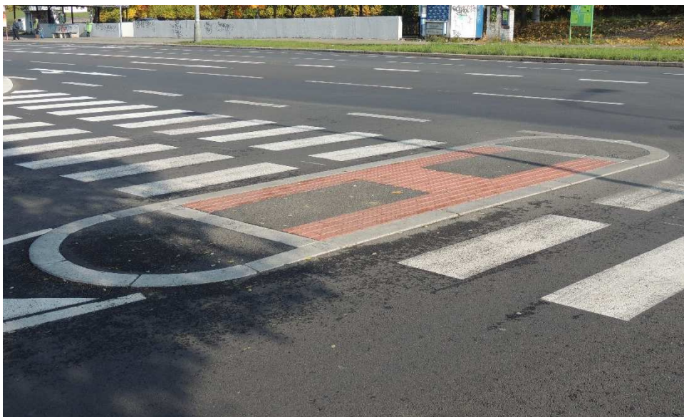
Obrázek 3: Pojízditelný dělicí ostrůvek na křižovatce Československého exilu x Povodňová

f) Chorvatská – Ruská - úsek je průjezdný bez problémů i 12 m autobusem, proto zde zkušební jízda již neproběhla