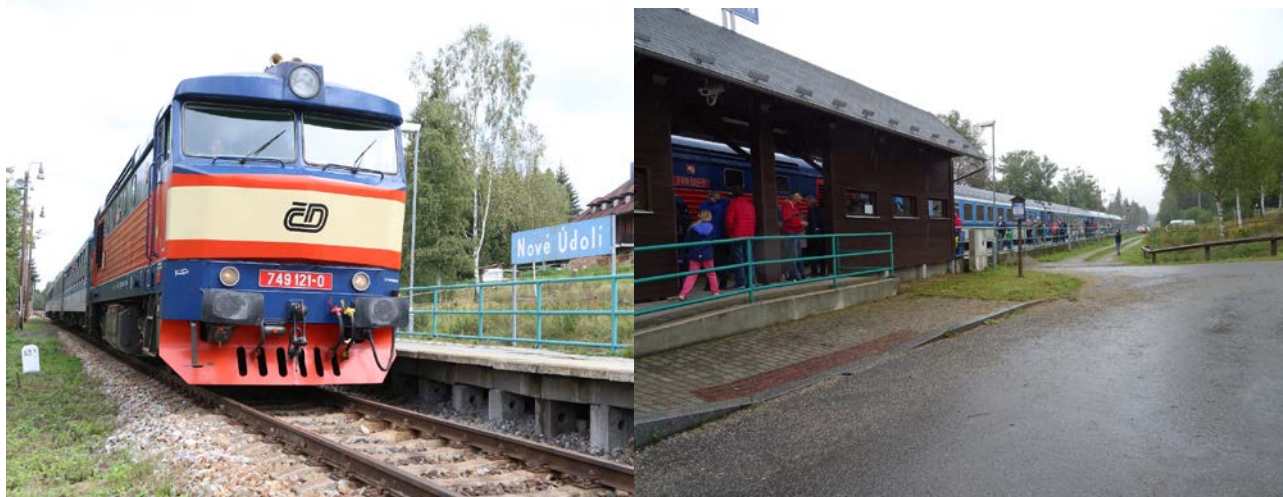
Ex 28531 Praha – Nové Údolí 7.9.2019

Zpracoval: Pavel Kosmata, +420 602 123 108