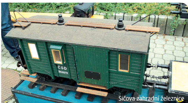
Sičova zahradní železnice