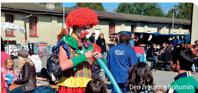
Den železnice Bohumín